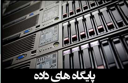
پایگاه های داده

شبکه و زیرساخت (Network Design & Infrastructure). شبکه‌های کامپیوتری مجموعه‌ای از کامپیوترهای مستقل متصل به یکدیگرند که با یکدیگر ارتباط داشته و تبادل داده می‌کنند. مستقل بودن کامپیوترها بدین معناست که هر کدام دارای واحدهای کنترلی و پردازشی مجزا بوده و بود و نبود یکی بر دیگری تاثیرگذار نیست. متصل بودن کامپیوترها یعنی از طریق یک رسانه فیزیکی مانند کابل، فیبر نوری، ماهواره‌ها و... به هم وصل می‌باشند. دو شرط فوق شروط لازم برای ایجاد یک شبکه کامپیوتری می‌باشند اما شرط کافی برای تشکیل یک شبکه کامپیوتری داشتن ارتباط و تبادل داده بین کامپیوترهاست. شرکت پارت شبکه پرداز با سابقه ای طولانی در طراحی، مشاوره و پیاده سازی زیرساخت و شبکه آمادگی طراحی و پیاده انواع شبکه های رایانه ای را دارا میباشد.