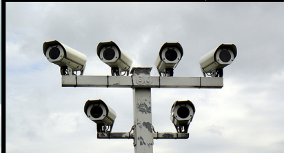
دوربین مدار بسته

پایگاه های داده (DataCenter). یکی از فعالیتهای شرکت پارت شبکه پرداز شبکه مشاوره، طراحی و اجرای مراکز دیتاستر می باشد. گسترش روز افزون صنعت IT و نیاز به ارائه خدمات تخصصی در زمینه ایجاد مراکز ذخیره سازی DataCenter و شبکه های کامپیوتری سبب شد تا شرکت پارت شبکه پرداز یکی از عمده فعالیتهای خود را در این حوزه ارائه نماید. شرکت پارت شبکه پرداز برای تأسیس و بهره برداری از مراکز دیتاستر با رعایت تمام استانداردهای جهانی و با در اختیار داشتن متخصصین مربوط به هر حوزه علاوه بر تأمین امکانات عمومی، این مراکز را به پیشرفته ترین تجهیزات فنی و زیر ساخت ارتباطی مجهز می نماید.