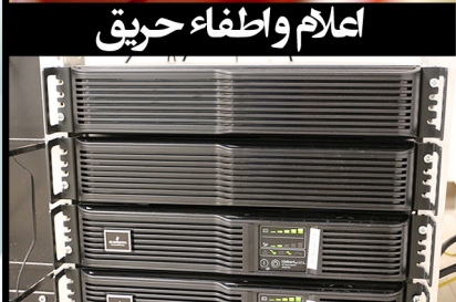
برق بدون وقفه

سیستمهای اعلام و اطفاء حریق (Fire Alarm & Fire Fighting). امروزه از سیستم های اعلام حریق به طور گسترده در ساختمان ها و اماکن مسکونی و صنعتی استفاده می شود تا خسارتهای ناشی از حریق را به حداقل برسانند و همچنین برای اطلاع دادن به ساکنین ساختمان در مواقع بروز حریق از این سیستم ها استفاده می شود تا حتی الامکان از تلفات جانی جلوگیری شود برای تشخیص حریق از اثرات سه گانه آن یعنی دود و حرارت و شعله استفاده میشود. شرکت پارت شبکه پرداز در این رابطه دارای تجاربی در سطح ملی بوده و توانائی اجرای پروژه های اعلام و اطفاء حریق در بالاترین سطح ممکن را دارا میباشد. کارشناسان پارت شبکه پرداز آمادگی کامل برای طراحی، مشاوره و پیاده سازی و تأمین تجهیزات سیستمهای اعلام و اطفاء را دارا میباشد.