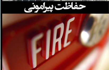
اعلام و اطفاء حریق

سیستمهای حفاظت پیرامونی (Perimeter Intrusion Detection System). شرکت پارت شبکه پرداز با بیش از ۱۰ سال سابقه در زمینه پیاده سازی سیستمهای حفاظت پیرامونی، میتواند راه کارهای مناسبی در این باره به مشتریان خود ارائه دهد. سطح حفاظت مورد نیاز برای هر ساختمان یا محوطه به طور معمول بر اساس سطح خطرات ناشی از تردد غیرمجاز یا فعالیتهای خرابکاری تعیین می شود. در حالت ایده ال طرح حفاظتی یک مجموعه شامل چند لایه مختلف حفاظتی می شود که مکمل یکدیگر می باشند. از این دیدگاه آشکارسازی تردد در پیرامون اماکن در اشکال مختلف آن برای اولین لایه حفاظتی کاملا مناسب است زیرا هم اقدام به ورود غیر مجاز را به سرعت به پرسنل اطلاع می دهد و هم به عنوان عامل ترس و تاخیر در ورود مهاجمان عمل می نماید. pids در این رابطه یک راهکار ارزشمند و مناسب است.